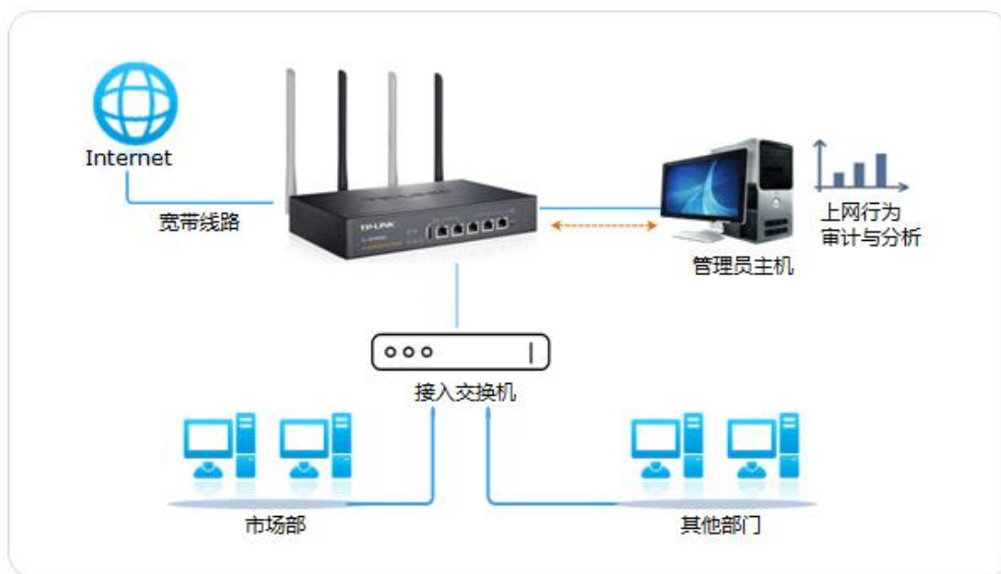
行为审计应用拓扑